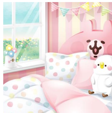
ピスケ&うさぎベッドルーム