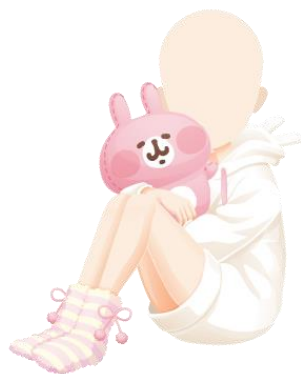
ラブリーうさぎパーカー