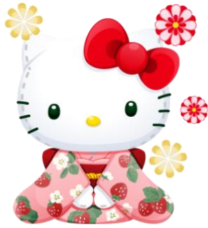
苺のお着物のハローキティ♪