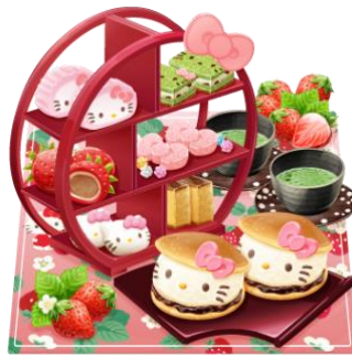
ハローキティの どら焼マリトッツォと和菓子セット