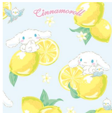
シナモロールとレモンの壁紙

© 2022 SANRIO CO., LTD. APPROVAL NO. L632589 (コラボアイテム一部紹介)