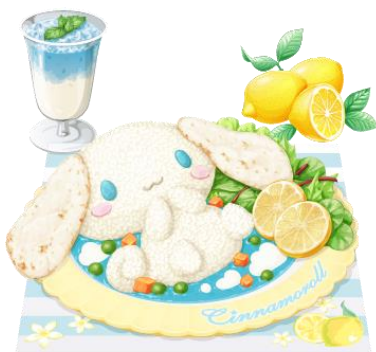
シナモロールのレモンカレー