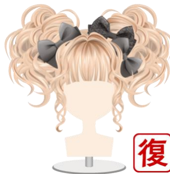
リボンラブカールヘア(ブロード)