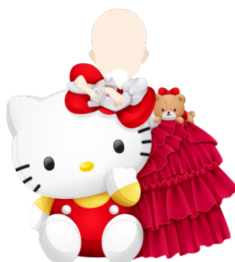
大好き！ハローキティ