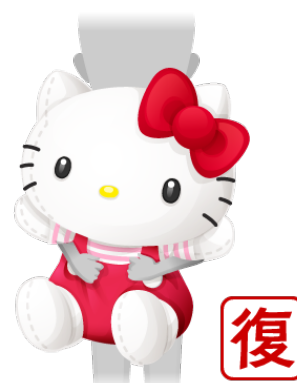
ぎゅっとビッグハローキティ(ラブ)

©1976, 1985, 2020 SANRIO CO., LTD. APPROVAL NO. S611037