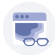
ルッキング ヒートマップ