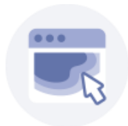
タップヒートマップ