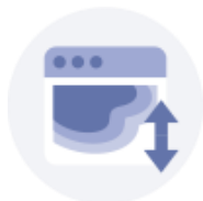
スクロール ヒートマップ