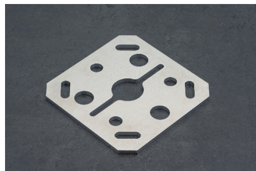
(左)寸法が規格化されたフラットバー素材、 (右)ミガキ材フラットバーを用いて製作した部品例