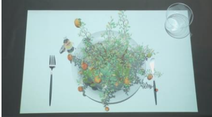
①樹に実った果実に

本編中、実際に映像に手をかざすことで、樹に実った果実を落とすことができ、収穫の手伝いを行う事ができます。「ルックさん」のコミカルな動きにも注目してください。