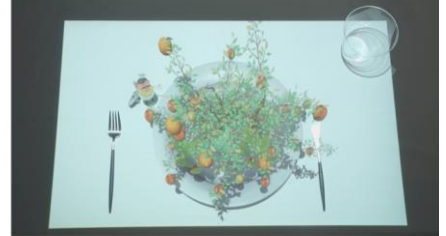
③果実が樹から落ちます。