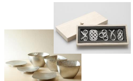
ブランド名 能作 販売価格: 1,620 円(税込)~

永く続く大切な人との絆を“末永く使える”製品で応援したい！ 錫製の和雑貨「能作」シリーズを、10%のシークレット割引にします。