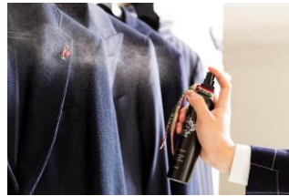
ブランド名:オロビアンコ(リネンスプレー) 販売価格: 2,160 円(税込)