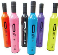
ブランド名:イザブレラ (折りたたみ傘) 販売価格: 3,024 円(税込)