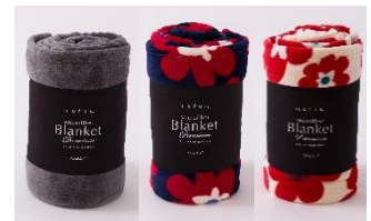
ブランド名 mofua(シングル毛布) 販売価格: 2,030 円(税込)

チョコレートに合わせて“友達用と自分用”を選んであったかお得！ルクサがプロデュースする常設店舗である Time mart で人気のシングル毛布「mofua」を 10%ギフト割にします。