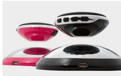
エアスピーカー 販売価格:24,624 円(税込)