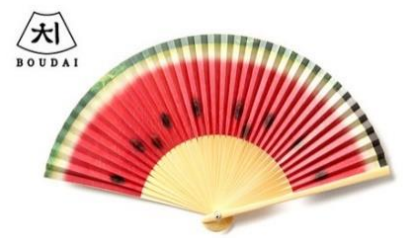
扇子 販売価格:3,024 円(税込)