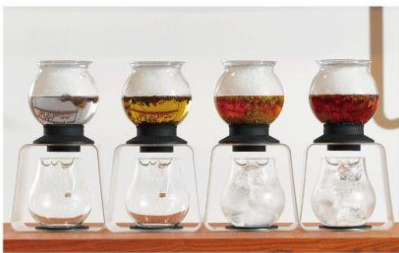
HARIO(ハリオ) ティードリッパーラルゴ スタンドセット 販売価格:8,640 円(税込)