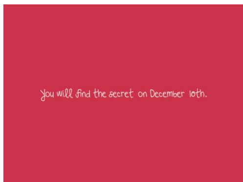
12月7日(日)~10日(水) 情報解禁前の準備サイト

スペシャルオファーカードに記載されていたURL「 http://sbcxmas.tokyo 」にアクセスすると特設サイトでは「You will find the secret on Decenber 10th」(12月10日秘密が明かされる)というメッセージのみ表示され、キャンペーンの詳細は秘密でした。そのため、スペシャルオファーカードのURL「sbc」部分をヒントにネット上では、様々な憶測が飛び交う状態でしたが、12月10日(水)に正式にサイトがオープンし、SeeByChloéのキャンペーンであることが明かされました。サイトには、カードを【12月11日(木)~12月21日(日)】の期間中、ラフォーレ原宿SeeByChloé店舗までご持参いただくと先着でSeeByChloéから素敵なプレゼントを贈呈しますという案内と「Wonder Christmas in SeeByChloé」キャンペーンの詳細が表示されました。