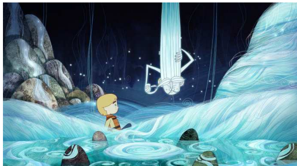
©Cartoon Saloon, Melusine Productions, The Big Farm, Superprod, Norlum