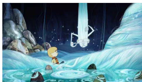
©Cartoon Saloon, Melusine Productions, The Big Farm, Superprod, Netum

監督 : トム・ムーア 製作国 : アイルランド 共同制作国 : ルクセンブルグ、ベルギー、フランス、 デンマーク 上映時間 : 93分