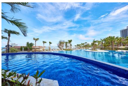
※通年営業 / 冬季は温水プール