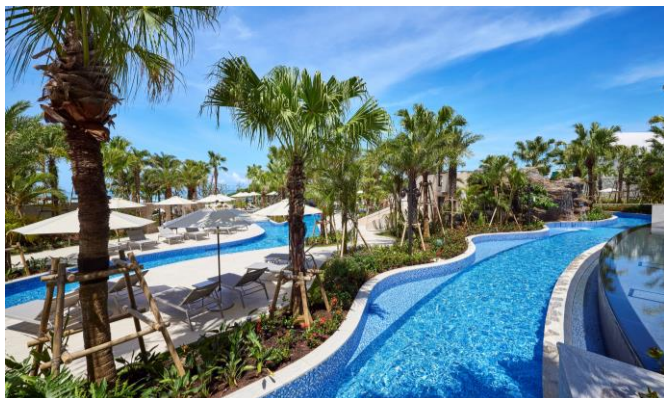
※ウォーター 슬라이ダー付