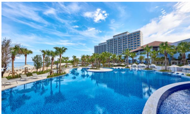
※全長約40mを誇るホテル最大のプール