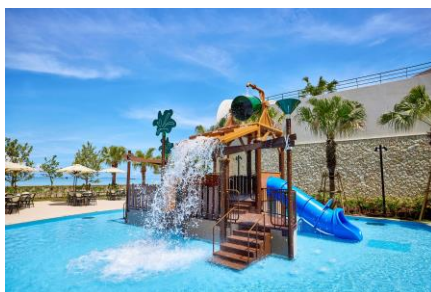
※巨大バケツがひっくり返るアトラクションが人気