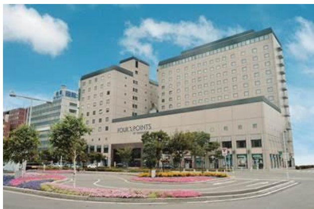
ホテル外観(イメージ)