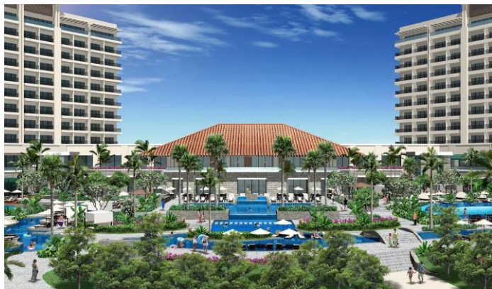
屋外プール（イメージ）

ご宿泊者様限定の6種のプールでは、お客様のスタイルに合ったお時間をお楽しみいただけます。ウォータースライダーを完備した流水プールのほか、1年を通じてご利用いただけるオールシーズンプールや屋内のインドアプールも備えており、季節や天気に左右されることなくご利用いただけます。なお、目の前には美しい白砂のビーチも広がり、存分にリゾートをご満喫いただけます。