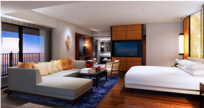
ジュニアスイート (58㎡)