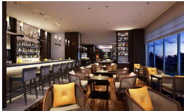
クラブラウンジ（イメージ）

スイートルームおよび一部のプレミアツインにご宿泊のお客様専用のクラブラウンジ。2階に位置し、美しいサンセットを望むテラス席も備えております。専用カウンターでのチェックイン・チェックアウトなど、パーソナルなサービスで、より上質なご滞在をご提供。ご朝食、ティータイム、カクテルタイムなど時間に沿ったサービスはもちろん、ピアノの生演奏やバーテンダーによるカクテルサービスなど、当ホテルならではの優雅なひとときをお楽しみいただけます。