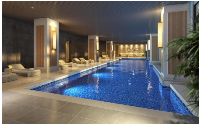
インドアプール（イメージ）