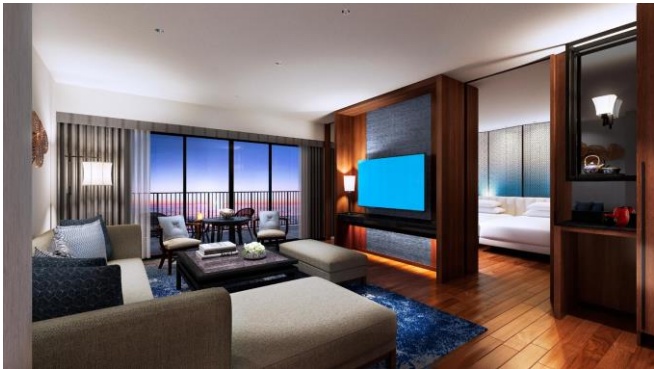
ロイヤルスイート (84㎡)