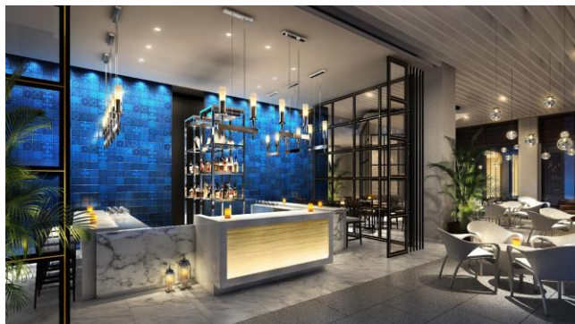
VIPプールバー Oasis（イメージ）