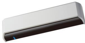
ビーコン内蔵 自動ドアメディアセンサー OAB-215V