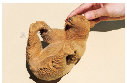
《シーソー熊》2017年クルミ 個人蔵

生命力あふれる木彫り作品が一堂に。 国立アイヌ民族博物館 第8回特別展示 生誕90年記念 藤戸竹喜の世界展 ■8月25日(日)まで ※ウポポイ入場料と別に「特別展示観覧料(大人:300円/ 高校生:200円)」が必要です。 ギャラリートーク ■8月10日(土)・11日(日) 14:00~14:30 映像上映会 ■8月17日(土)14:00~14:30