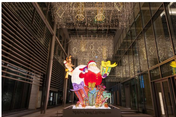
▲「GALLERIA Winter Lights」