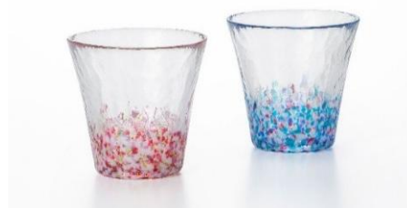
津軽びいどろ (2 階) にほんの色グラスペア 3,850 円（税込）