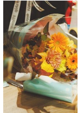
ワークショップ（イメージ）

※予約サイトは順次東京ミッドタウン八重洲の公式 HP・Instagram よりご案内いたします。