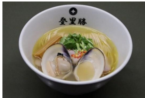
POPUP ラーメン 登里勝 (2 階) 大はまぐり塩らめん 1,380 円 (税込)