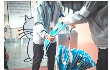
花の無料配布（イメージ）