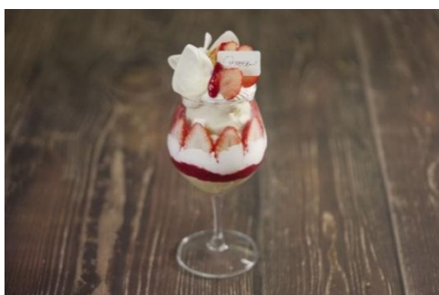
EN VEDETTE LUXE (1 階) パフェレーズ 2,750 円（税込）