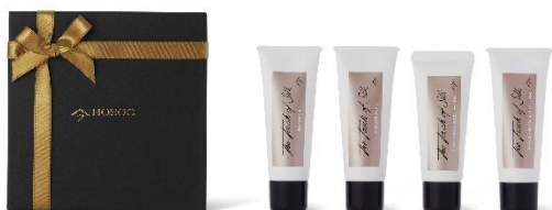
HOSOO TOKYO (1 階) Discovery Set 17,600 円（税込）

東京ミッドタウン八重洲から、春の訪れを感じるおすすめのギフトや、この季節ならではのメニューをご紹介します。センスが光るあの人へ、贈る相手を思い浮かべながら選べるラインアップをご用意しました。また、春の気分を感じられる今だけのグルメもお楽しみいただけます。