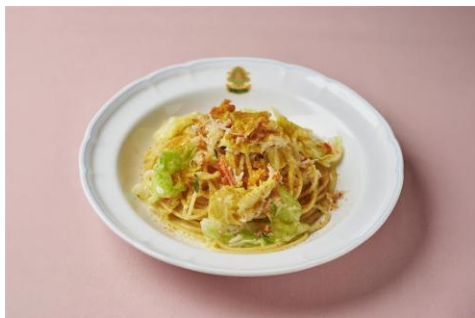
ラ・テラツァ サバティーニ (3 階) ズワイガニと春キャベツのスパゲッティ イタリア産ボトルガ添え 3,080 円 (税込)