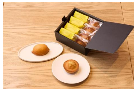
POINT ET LIGNE (1 階) 焼き菓子ギフトセット 3,540 円（税込）