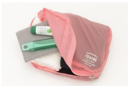
TO&FRO (2 階) ORGANIZER AIR -PASTEL- 3,190-5,500 円（税込）