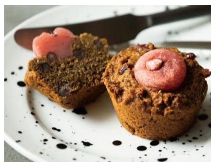
THE CITY BAKERY (B1 階) さくらマフィン イートイン/418 円（税込） テイクアウト/410 円（税込） ※店舗により取扱いや価格が異なります。