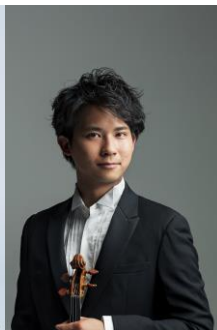
三浦文彰さん