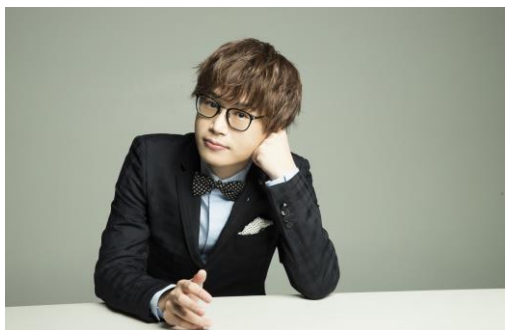
たくおん / クラシックピアノ(2022年度選出)

アルバムがクラシックCDとしては異例のオリコン3位にランクインするなど今最もチケットが手に入らないピアニストの1人