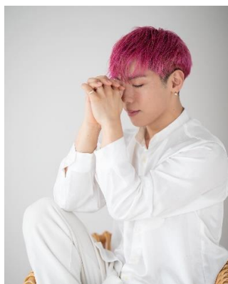
IG / ダンサー・振付師(2023年度選出)