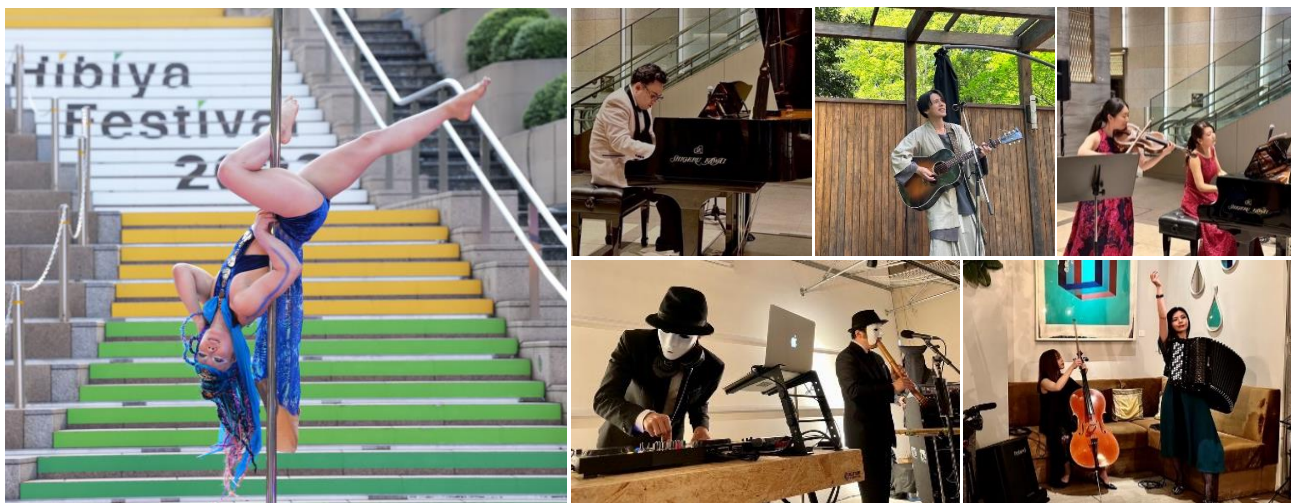
「Hibiya Festival 2023」へ出演した“NEXTアーティスト”の様子

東京ミッドタウン日比谷（千代田区有楽町 事業者：三井不動産株式会社）を運営する東京ミッドタウンマネジメント株式会社は、芸術文化・伝統芸能の発信と若手のアーティスト活躍応援を目的とした「あなたが“NEXTアーティスト”！～若手応援プロジェクト～2024」を本年も始動し、11月1日（水）より来年開催予定の「Hibiya Festival 2024」にご出演いただく“NEXTアーティスト”の募集を開始いたします。