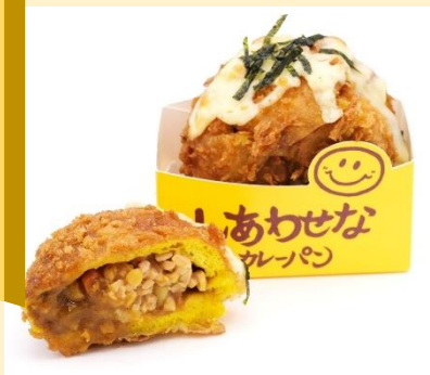
しあわせな納豆カレーパン boulangerie Bonheur (B1)