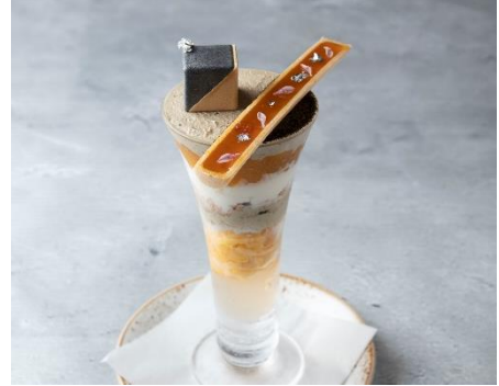
伏見梅園の完熟梅とほうじ茶のパフェ 価格：1,800円