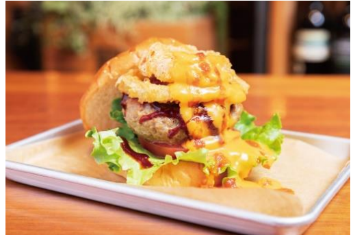
ハバネロチーズバーガー 価格：1,600円