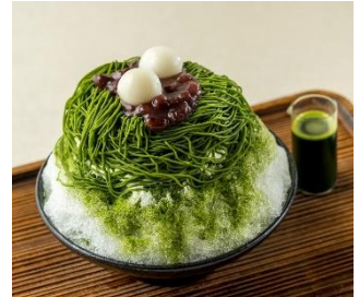
和モンブラン氷 価格：1,980円

※価格はすべて税込みです ※画像はすべてイメージです。実際の内容とは異なる場合がございます ※掲載している情報は変更になる場合がございます。あらかじめご了承ください ※急な営業時間の変更・アルコール提供の中止、臨時休業が発生する可能性があります