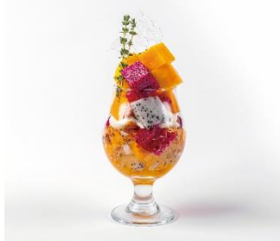
トロピカルパフェ 価格：1,650円