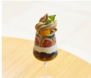
いちじくとバタフライピーのパフェ 価格：1,980円