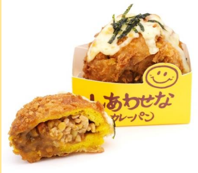
しあわせな納豆カレーパン 価格：340円