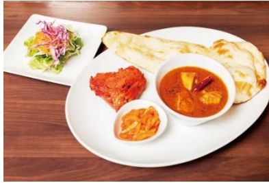
チキンミルチカレーセット 価格：1,500円