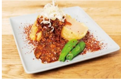
辛味噌おでん 大根天 価格：650円