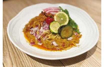
ヴィーガンスパイス担々麺 価格：1,580円