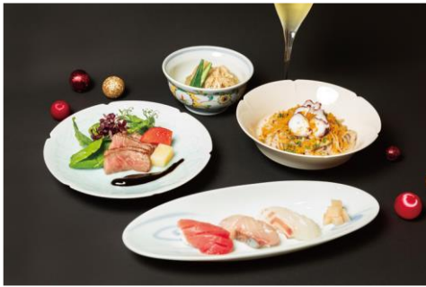
クリスマス限定コース おまかせコース 22,000 円 おすすめコース 12,000 円 そばがみ/3F ※ディナータイム限定 ※提供期間：12/1(日)～12/25(水) ※当日予約可