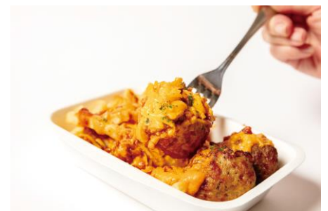
MEATBALLS & NACHO FRIES 1,100円 Susan's MEAT BALL/B1

※価格はすべて税込です※詳細は各店舗にお問合せください※内容・価格は変更になる場合がございます