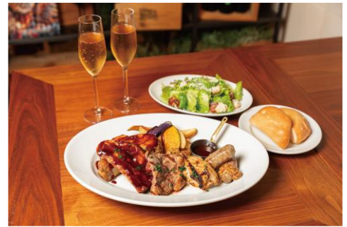
Pair Dinner Set 5,500 円 BROOKLYN CITY GRILL/B1 ※ディナータイム限定 ※提供期間：11/14(木)～12/25(水) ※各日限定 10 組