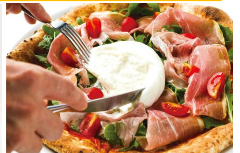
マルゲリータ & ブッラータ 3,190円 GOOD CHEESE GOOD PIZZA/2F