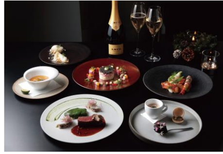
ニッポンテロワールを味わうクリスマスコース 13,000 円～ DRAWING HOUSE OF HIBIYA/6F ※ディナータイム限定 ※提供期間：12/21(土)～ 12/25(水) ※要予約 (前日まで)