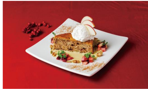
りんごとアールグレイのケーキ ～Berry Xmas リース～ 1,199円 Mr.FARMER/B1