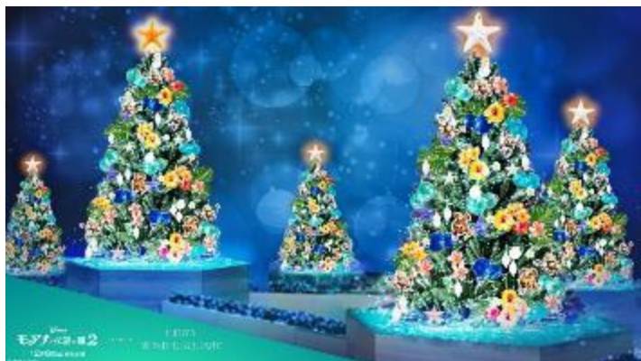
『モアナと伝説の海2』×東京ミッドタウン日比谷 ツリーイメージ