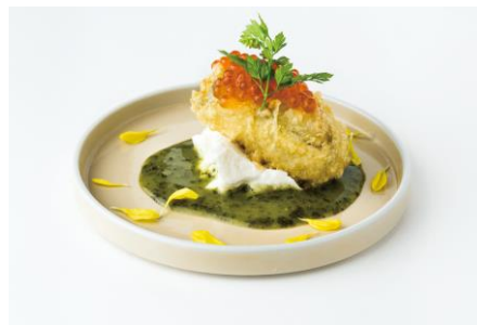
牡蠣天 ～リコッタチーズとジェノベーゼ ソース～ 700円 天ぷら 天丼/2F