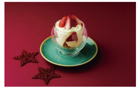
クリームチーズパフェ 890円 DIYA/2F ※提供期間：12/1(日)～12/25(水)