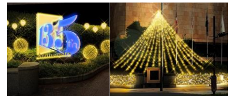
帝国ホテル 東京イルミネーションイメージ

URL： https://www.imperialhotel.co.jp/tokyo/special/xmas-2024