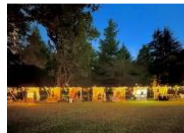
日比谷公園イルミネーションイメージ

URL： https://www.tokyo-park.or.jp/park/hibiya/news/2024/hibiya_park_terrace_xmas_design_market.html