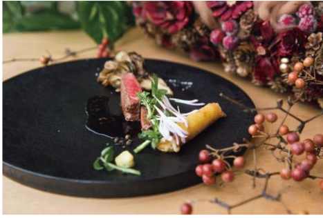
クリスマス特別メニュー 26,620 円 RESTAURANT TOYO/3F ※ディナータイム限定 ※提供期間：12/21(土)～12/25(水) ※要予約 (2 日前まで) ※個室あり