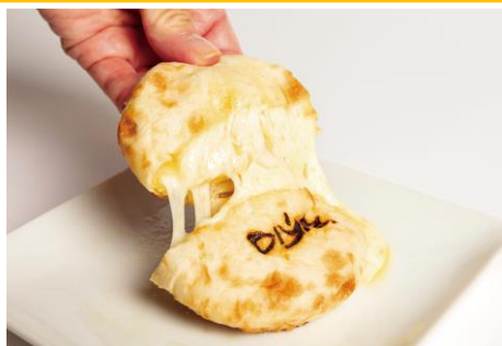
おつまみチーズナン 1個 680円 (ブルーチーズ入り 1個 900円) DIYA/2F