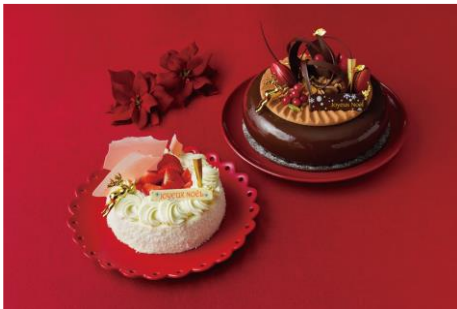
NOEL FRAISE 4,800円 (左) CACAO FOREST 9,860円 (右) Pâtisserie & Café DEL'IMMO/B1 ※予約期間：12/16(月)まで ※受渡期間：12/21(土)～12/25(水)