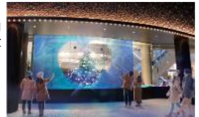
日比谷シャンテイルミネーションイメージ

URL： https://www.hibiya-chanter.com/eventnews/detail/?cd=000075