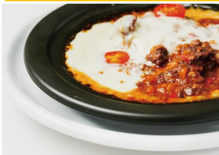
RGC ラザニア 1,980円 Q CAFE by Royal Garden Cafe /6F ※提供時間：15:00～