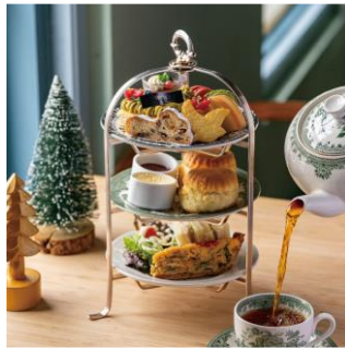
KIKI's Afternoon Tea Set 「KIKI のクリスマスキャロル」 4,950 円 TEA ROOM KIKI 紅茶&ス ク専門店/B1 ※各日 30 食限定 ※提供期間：12/2(月)～ 12/25(水) ※要予約 (2 日前まで)