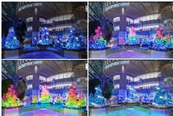
ツリー特別演出イメージ

「HIBIYA Magic Time Illumination 2024」のメイン会場となる日比谷ステップ広場には、イベント開始から12月25日（水）での期間、ディズニー・アニメーション映画『モアナと伝説の海2』の世界観を表現したイルミネーションが登場します。7本のクリスマスツリーを中心として、映画の象徴である広大な海を想起させるブルーを基調としたライトや、南国の植物や海の貝殻やヒトデをイメージしたオーナメントにより、まるで映画の中にいるような感覚を楽しめるフルカラーイルミネーションが広場を彩ります。