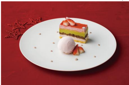
イチゴとルビーチョコのセツペーリ 1,650円 DRAWING HOUSE OF HIBIYA/6F