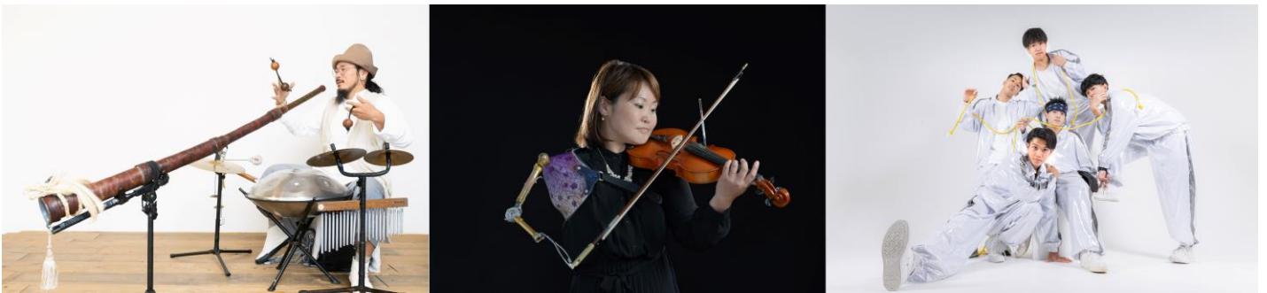
選出されたアーティスト（一部）

東京ミッドタウン日比谷（千代田区有楽町 事業者：三井不動産株式会社）を運営する東京ミッドタウンマネジメント株式会社が、芸術文化・伝統芸能の発信と若手のアーティスト活躍応援を目的として実施する「あなたが「NEXTアーティスト」～若手応援プロジェクト～2025」企画において、選考により13組の「NEXTアーティスト」が決定いたしました。選出された「NEXTアーティスト」は、2018年から開催しているエンターテインメントの祭典「Hibiya Festival 2025」への出演を確約。東京ミッドタウン日比谷をはじめとした商業施設やレストランなど、日比谷の街中でのパフォーマンスを予定 ※1 しています。