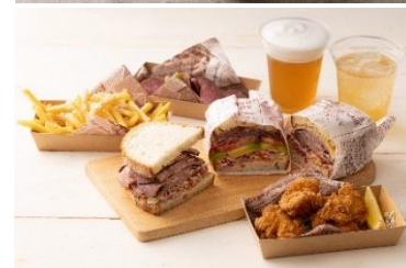
▲HIBIYA SUMMER DINER メニュー