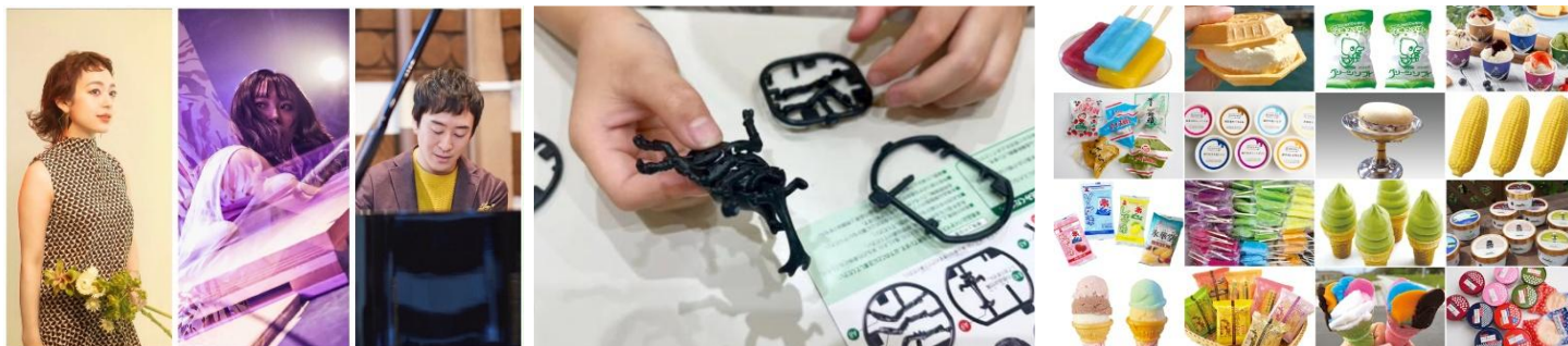
▲HIBIYA MUSIC LIVE 出演者

この度、「HIBIYA SUMMER DINER」にて、食事と一緒にジャズなどを生演奏で楽しめる「HIBIYA MUSIC LIVE」の開催が決定！また、体験を通してSDGsについて学べる「MOTTAINAI！アップサイクルワークショップ」をお盆期間に館内で実施します。そして、日本アイスマニア協会が全国47都道府県から厳選したご当地アイスが集結するクラフトソフトクリームとご当地アイスの専門店「あいぱく®TOKYO」が期間限定でオープンします。さらに、2011年に始まり、今年で14回目となる夏の恒例行事「エンタの街 日比谷 打ち水月間」も実施し、日比谷の街全体で夏のにぎわいを創出します。