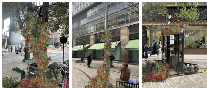
▲「ボタニカルストリート～日々感謝～」(イメージ)