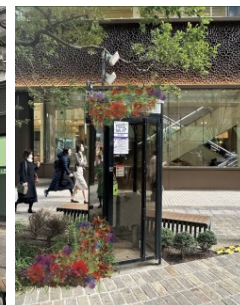
▲「ボタニカルストリート～日々感謝～」(イメージ)