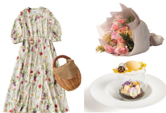
▲館内春アイテム&フードメニュー (イメージ)