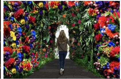
▲「Blossom Garden～植物彫刻～」(イメージ)