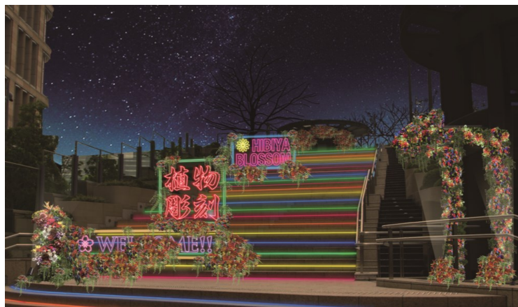
▲「Blossom Garden～植物彫刻～」(イメージ)