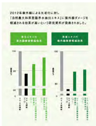
「自然農大和茶亜臨界水抽出エキス」効果測定結果