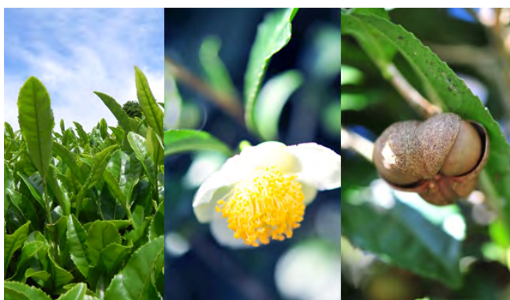
左より 茶葉、茶花、茶実

フレッシュな初摘み大和茶に加えて、汗や皮脂で開きがちなお肌をひきしめる「ハマメリス」と、日差しによるほてりを鎮め、健やかな素肌感を高める「ペパーミント」をブレンド。水を一滴も使わず、蒸留水をベースに贅沢に仕上げました。たっぷりお使いいただける、夏仕様のフレッシュなミストです。