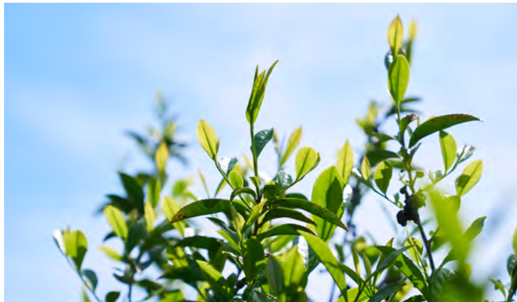
健一自然農園さんの大和茶

八十八夜の前後に摘み取った大和茶を、佐賀県唐津市の自社工場「FACTO」へ直送。一つひとつ手作業で細心の注意を払いながら製造し、原料の持つ個性を最大限に引き出したアイテムに仕上げています。