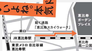
恵比寿 ガーデン プレイス 恵比寿 南一公園

JR山手線「恵比寿駅」東口 徒歩5分 東京メトロ 日比谷線「恵比寿駅」1番出口 徒歩7分 動く通路「恵比寿スカイウォーク」を道なりに進むと恵比寿 ガーデンプレイスが見えます。