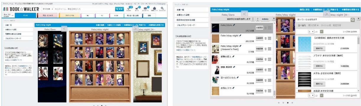
ブラウザでの表示イメージ (左) 編集画面 (右)

BOOK☆WALKER では、「電子で本を持つ喜びを提供する」ことをサービスポリシーの一つとし、電子書籍を読む楽しみだけでなく、電子書籍を中心とした様々な体験をより充実したものにできるよう、今後もサービスの拡充に努めてまいります。