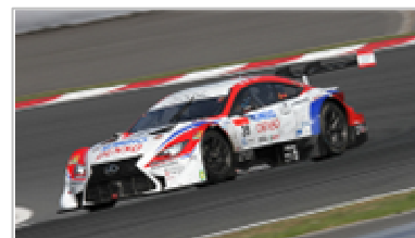
展示車両 DENSO KOBELCO SARD RC F