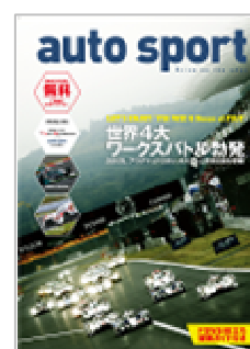
autosport SPECIAL ISSUE