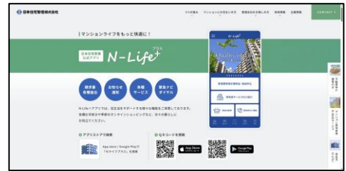
マンションにお住まいの方

同ページでは、日本管財住宅管理および日本住宅管理が提供する、居住者向けマイページサービス「N-WEB」や、暮らしをサポートするサービス「N-Life+」をはじめとする各種サービスへの動線を整備し、日常的なお手続きやお問い合わせをより分かりやすくご案内できる構成としています。