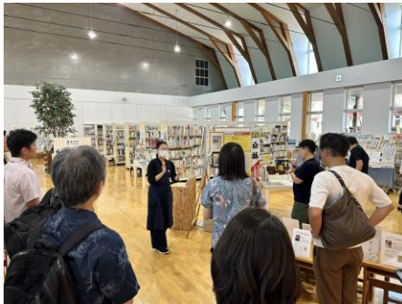
紫波町図書館での見学の様子