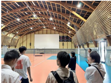
オガールベースでの見学の様子

翌日7日（水）には、希望者を対象に紫波町の公民連携事業オガールプロジェクトや、民間主導でリノベーションまちづくりを進める日詰商店街の見学ツアーを開催いたしました。オガールの各施設の役割や使われ方と、日詰商店街の事業者の思いや本音をお話いただきました。