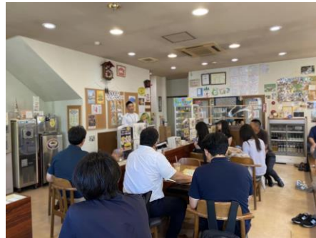
日詰商店街での見学の様子