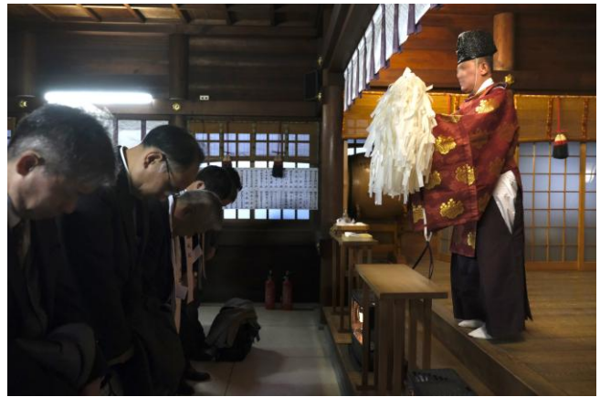
中部支部 / 朝日神社