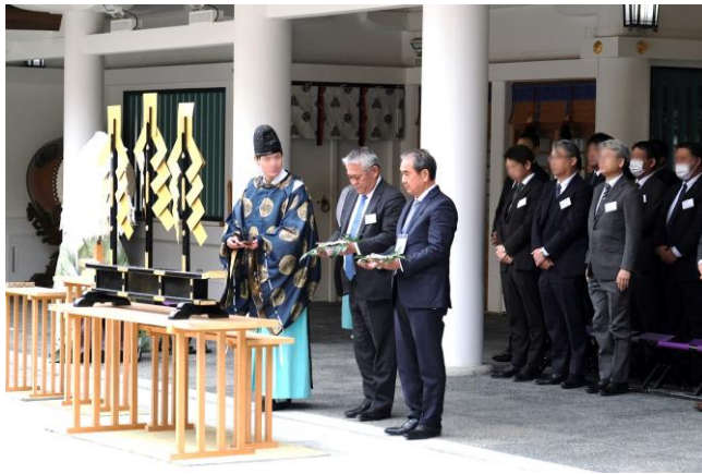
関西支部 / 西宮神社