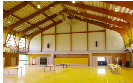
「KOMOROBiスタジアム」イメージ

「コモロビスタジアム」は雨でも楽しめる体育館。バスケットコート2面分の広々としたスタジアム内に天候に左右されず自然体験ができるオリジナルプログラムを多数ご用意。道具を使わずに重さや長さを測ったり、手を使わず紙を動かすなど、機械やゲーム機ではなく、身近なものでチャレンジできるコンテンツがあります。他には1DAYチケット利用者もテントや寝袋を体験できるアウトドア体験コーナーや、小さなお子さまが遊べるようにキッズスペースも備えております。コモロビスタジアムと森のアトリエのように、屋根付き施設も あって雨天でも楽しめるのが「KOMOROBi Athletic & Camp」の特徴です。