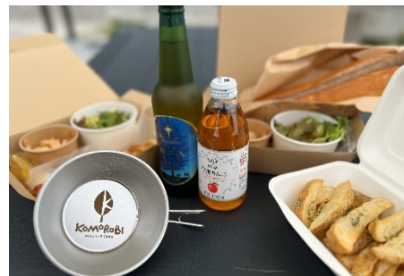
カフェメニューイメージ

施設名が由来の「KOMO SET」「ROBI SET」(各1,500円)を中心に各種サイドメニューやドリンクを販売します。特に、「KOMO SET」のメインであるホットドッグは、顔より大きいと話題になる約30cmの大きさと人気のメニューです。地元の食材を使ったサラダやアルコールの提供などもしているため、自然の中で「KOMOROBi Athletic & Camp」ならではの食を楽しんでいただけます。