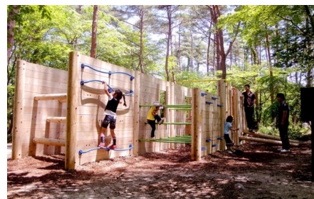
「山のアスレチックフィールド」イメージ

総面積3,200平方メートルと広大な森の中に、体全体を動かして遊べるアスレチック施設を設置。ネットや木を利用し、大自然の中だからこそ実現が可能な大規模なアスレチックです。中でも、木材の組み方によって様々な形や仕掛けに変化する、自然の素材のみで作られたアスレチックは、周囲の森の雰囲気とも一体化しており注目の施設です。さまざまな難易度のアスレチックが、山の斜面を利用して13基設置されており、子供から大人まで楽しめます。