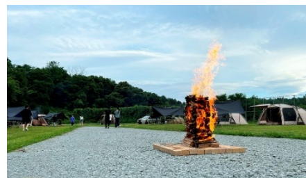
「炎のキャンプフィールド」イメージ

「炎のキャンプフィールド」は間隔を広めに保って張られたテントと、エリアの中心で燃え上がるキャンプファイヤーが特徴です。最大16のテントを張ることが可能。全サイト車を横付けすることが可能で、テント間を広く保っているため、周囲のテントを気にすることなく過ごしやすいのも特徴です。キャンプの目玉とも言えるキャンプファイヤーは、エリアのシンボルとして各テントから見えるよう中心に設置。高さ3メートルにのぼる炎のゆらめきを眺めながら、憩いの時間を過ごすことができます。