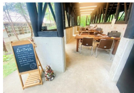
「森のアトリエ」イメージ

BBQエリア、森の広場、森のアトリエ、森の泉、イベントスペースからなるコモロビの森。「KOMOROBI Athletic & Camp」の森内に全9サイトで配備されたBBQエリアは、BBQ付チケットにて利用可能。森の中にも、ツリーハウスやスラックラインなど、自然を満喫できるコンテンツがたくさん。子供は思いっきり体を動かしながら、大人はBBQを楽しむことができます。また、森のアトリエでは、松ぼっくりアートなど、自然を活かした木エクラフトなどが楽しめます。