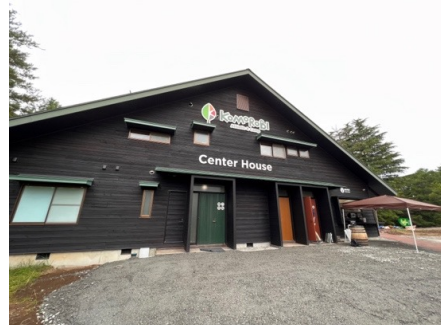
センターハウス外観

キャンプ場の中心に位置するセンターハウスには、パウダールームやシャワールーム、ベビーベッドなど、子育て世代や女性に優しいスペースが充実しています。より快適にキャンプを楽しめるよう、衛生環境も整っている点が特徴です。