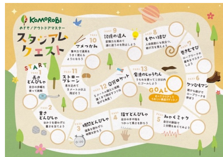
「スタジアムクエスト」カード

バスケットコート2面分の広々としたコモロビスタジアム内に、設定された13種のクエストのクリアを目指すコンテンツが登場。全てクリアしてスタンプを集めると景品がもらえます。コモロビスタジアム内に設置されているため、天候に左右されずに参加できるクエストです。長さや重さを自身の感覚で測るゲームや傘袋でロケットを作る工作、もやし結びなどの紐の結び方まで、楽しみながら勉強できる内容も多数。アウトドアに活用できるものばかりでキャンプ場ならではの遊びを体験できます。