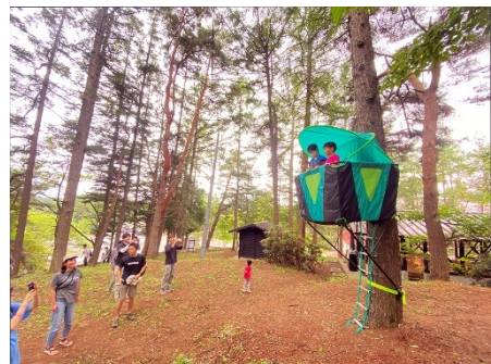
「ツリーハウス」イメージ

背の高い木々と一体化するように設置された2つのツリーハウスに登ると、より一層鳥や虫の鳴き声を近くに感じることができます。そして、向かい側のツリーハウスと、空中での会話を楽しめるのも特徴です。周辺にはボルダリングやスラックラインなども設置されており、自然の中で体を動かしながら遊べるアクティビティが豊富なエリアです。