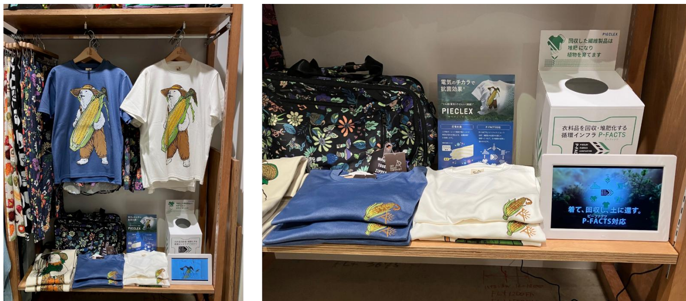
go slow caravan エミテラス所沢店の売り場（時期によりレイアウトは異なります）

第3弾の発売に合わせ、新たにエミテラス所沢店・ゆめが丘ソラトス店の2店舗に P-FACTS 回収ボックスを設置いただき、go slow caravan における P-FACTS 回収ボックス設置店舗が計 6 店舗に広がりました。