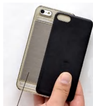
高性能電波吸収体

カードを取り出さずにリーダーにかざすだけで、改札エラーを起こすことなくスムーズに安心して通過できます。