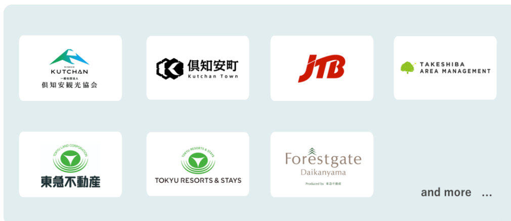
導入企業・自治体一覧