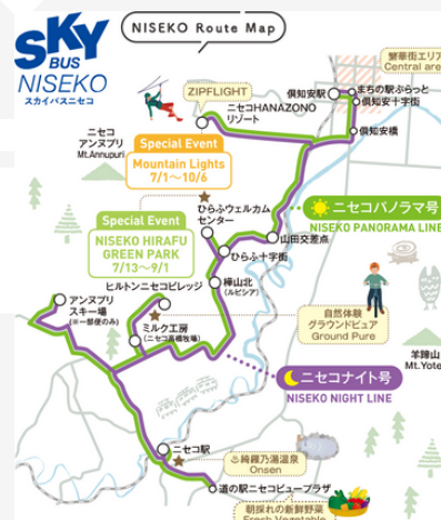
スカイバスニセコのルートマップ