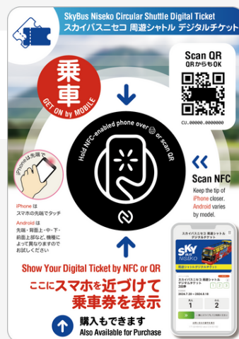
チケットを使用する際にタッチするNFCプレート

スカイバスのチケット利用環境の構築において「Machi-wai」基盤に電子チケットの決済と管理機能を追加実装することで実現しました。なお、「Machi-wai」ではSaaS型のWEBアプリとNFCにより、オンライン、オフラインを跨ぐ仕組みを安価に短期間で準備することが可能です。また、取得データから利用動向を分析することでデータドリブンな運用を可能とします。