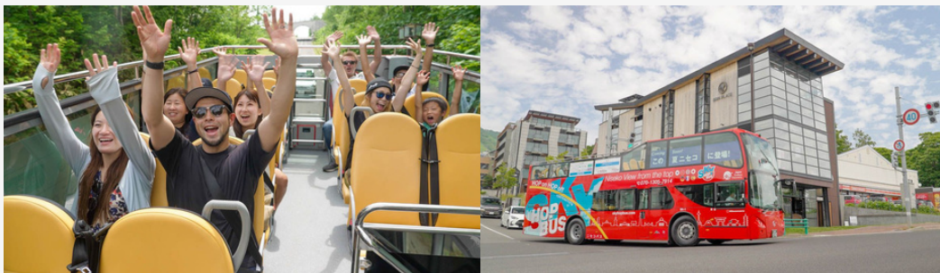
スカイバスニセコの様子

スカイバスニセコは、オープントップバスにて運行されるグリーンシーズン限定のバスサービスで、目の前に広がるニセコの景色と雄大で美しい羊蹄山を楽しみながら、NISEKO HIRAFU GREEN PARKやHANAZONOマウンテンライツなど限定のスペシャルイベントを巡ることができ、一味違うニセコ観光を堪能できます。