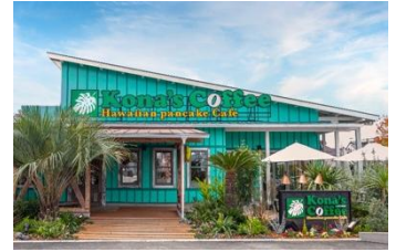
外観（八千代緑が丘店）

さまざまなシーンでご利用いただける雰囲気と、バリエーション豊かなメニューで、昼夜を問わず思い思いのハワイ時間をお過ごしください。