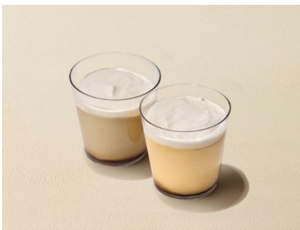
(左) KNOWS コーヒープリン

「KNOWS COFFEE」で人気のスムージーに、初夏にぴったりの限定メニューが登場します！ピンクグレープフルーツとホワイトグレープフルーツの果肉に氷を合わせてミキサーにかけ、グレープフルーツ本来の果実感を引き立てました。グラスの一番下には、ピンクグレープフルーツのジュレと果肉を仕立て、全体をよく混ぜてお召し上がりいただくことで、果肉の存在感とジュレのぷるんとした食感をより一層お楽しみいただけます。層が織りなす美しいグラデーションは、「ハワイのサンセット」を思わせる、「KNOWS COFFEE」らしい一杯です。