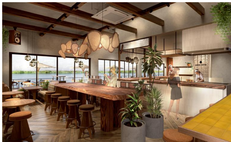
KNOWS COFFEE イオンレイクタウンアウトレット 内観/外観 ※一部変更される可能性があります

「KNOWS COFFEE」は、全国に55店舗*を展開するハワイアン カフェ・レストラン「コナズ珈琲」の姉妹ブランドとして誕生しました。2026年3月18日に千葉県津田沼に1号店をオープンして以来、「コナズ珈琲」をご愛顧いただいているお客さまをはじめ、周辺にお住まいの方々など、非常に多くのお客さまにご来店いただいています。その反響を受け、このたび2号店となる「KNOWS COFFEE イオンレイクタウンアウトレット」の出店が決定しました。