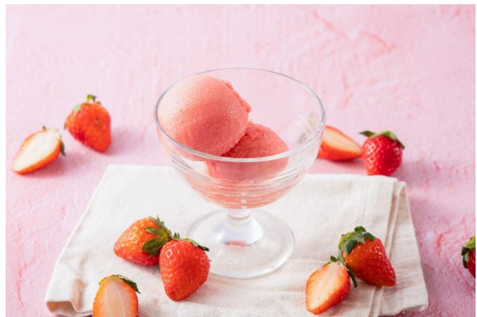
ストロベリーシャーベット