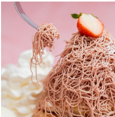
ストロベリーモンブランクリーム