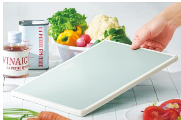
持つと実感する軽さ！