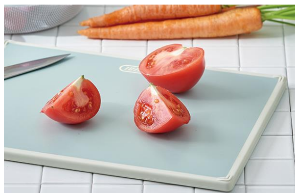
Ag + 抗菌で清潔&安心！