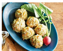
キャバツとにんじんのしゅうまい