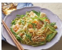
シーフード焼きそば