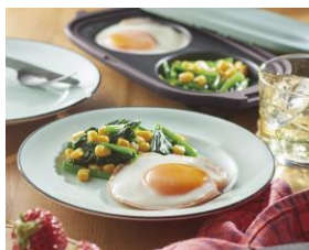
ハムエッグとほうれん草ソテー