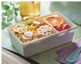
いり卵と鶏そぼろ