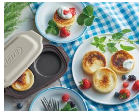
ヨーグルト蒸しケーキ