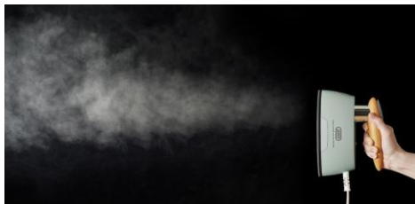
1分あたり約 20g の大量スチーム！

アイロン温度は洗濯表示に合わせた設定が可能で、素材に合わせた温度で衣類ケアできます。