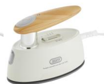
ASH WHITE HW-SM2-AW