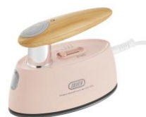
SHELL PINK HW-SM2-SP