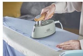
細かな場所もしっかりシワ取り