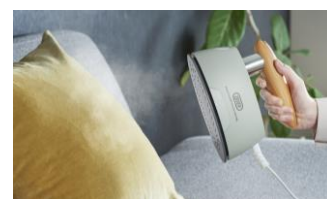
お部屋のファブリックに

殺ダニ効果も高く、スギ花粉やハウスダストといったアレル物質も低減できます※3、4。