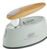
PALE AQUA HW-SM2-PA

製品ページ : https://ladonna-co.net/products/item/hw-sm2/