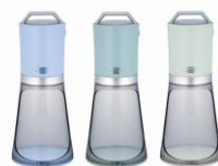
PALE BLUE PALE AQUA ASH WHITE