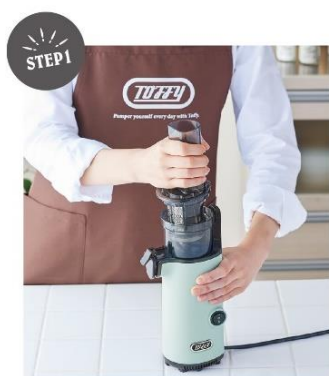
タンクとふたを本体にセットする