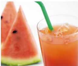
スイカトマトジュース