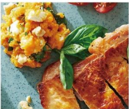
チキンソテー にんじんペースト添え