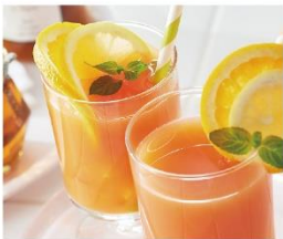
オレンジと グレープフルーツのジュース