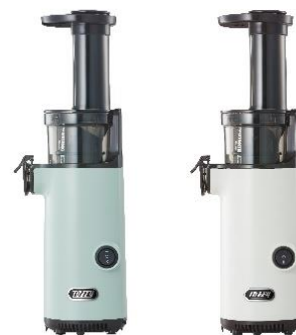
パールアクア アッシュホワイト

品名 : Toffy ミニスロージューサー 価格 : 本体価格¥8,800+消費税 発売 : 2020年10月21日(水) 製品ページ : https://ladonna-co.net/products/item/k-bd4/