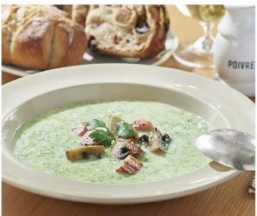
ブロッコリースープ