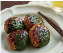
れんこんのシャキもちつくね