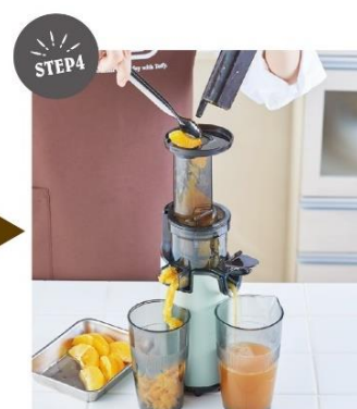
フレッシュジュースの完成！！