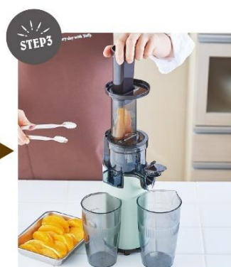
プッシュするだけ！