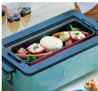
焼き野菜&チーズコロット