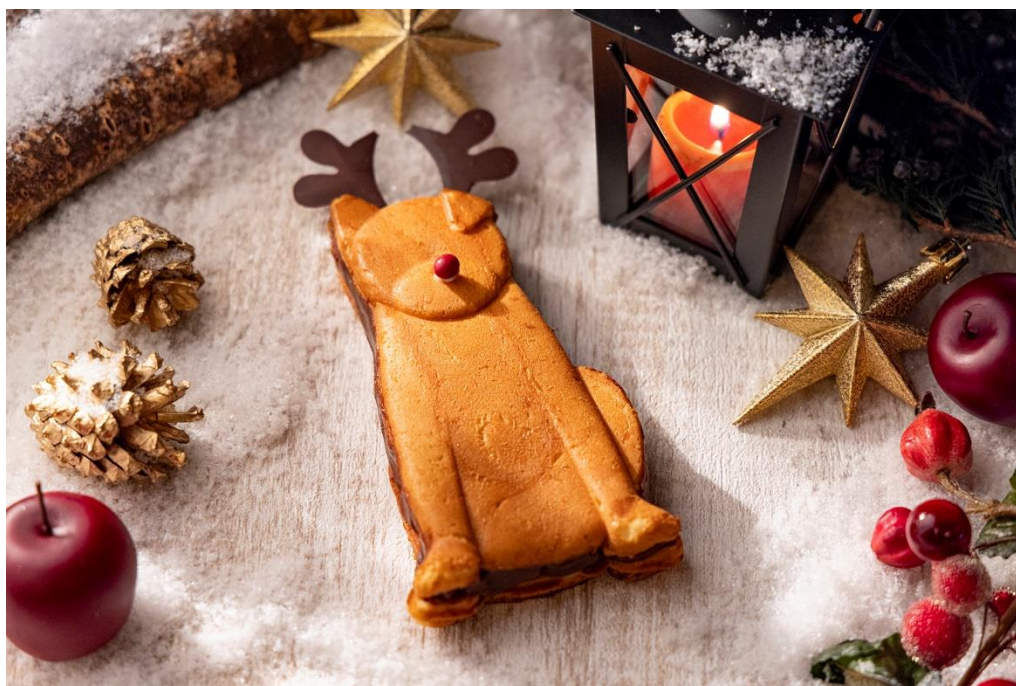
2023年フェスティブシーズン販売時のハチ公ワッフルデザイン