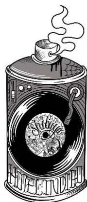
※Yuya the fxxkin 氏によるスプレー缶デザインイメージ

ルーフトップテラスの展望デッキにはスプレー缶をモチーフにデザイン・設置されたボタンが登場。お客様ご自身がボタンを押すことができ、押すとイルミネーションのカラーが変化します。カラーバリエーションはブルー&ゴールド&ホワイトのコンビネーションとライトブルー単色のご用意です。スプレー缶にはタトゥーアーティスト Yuya the fxxkin 氏に、特別にこのイルミネーションのために描いていただいたイラストが。渋谷のレコードカルチャーやストリートカルチャーからインスパイアを受け、イルミネーションのテーマである「SPRAY IT ALL」との交錯を表現していただいています。