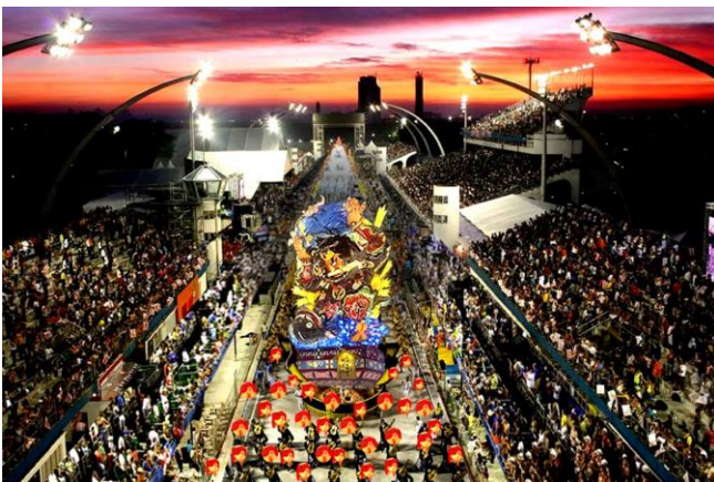
サンバカーニバル 出場イメージ

加えて、「アギア・ジ・オウロ」のカーニバルパートには、当プロジェクトの実行委員であり、発起人でもあるファッションデザイナーのコシノジュンコ氏、五所川原市平山誠敏市長のほか、現地在住の日本人や日系人のダンサーが参加し、参加者は、コシノジュンコ氏がデザインした法被を衣装として着用する予定となっております。