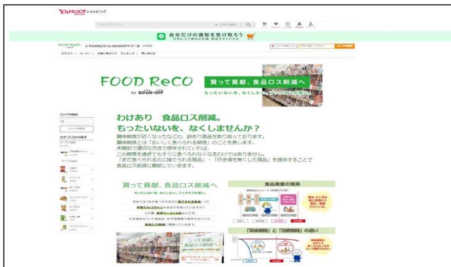
ECショップ「FOOD ReCO」Yahoo!ショッピング店トップページ

■ホームページ： https://store.shopping.yahoo.co.jp/foodrecobybookoff/